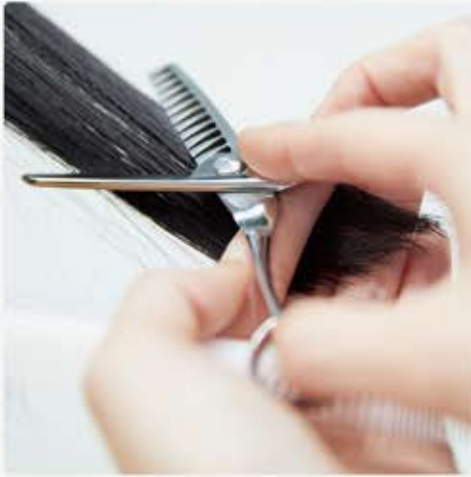
VALKYRJA PORTABLE SKILLS